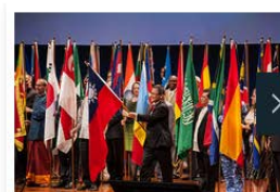
International Conference Toastmasters