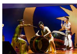
International Conference Toastmasters