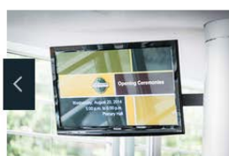
International Conference Toastmasters